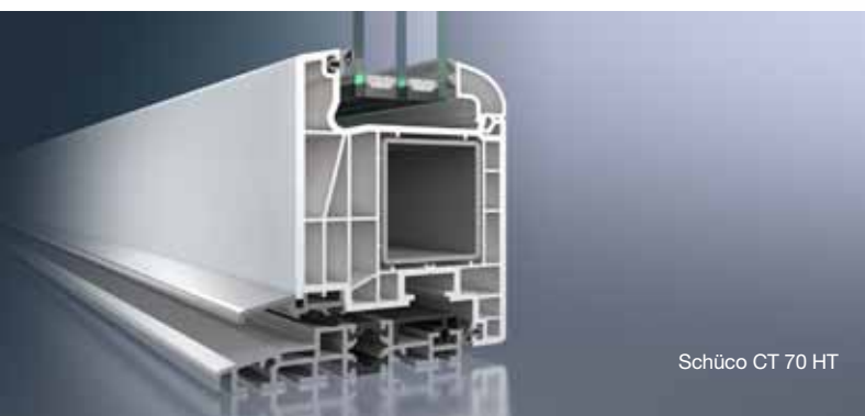
Schüco CT 70 HT