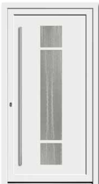
Modell 5742 Glas: Chinchilla weiß