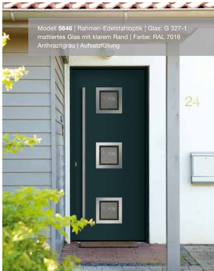
Modell 5646 | Rahmen-Edelstahloptik | Glas: G 327-1 mattiertes Glas mit klarem Rand | Farbe: RAL 7016 Anthrazitgrau | Aufsatzfüllung