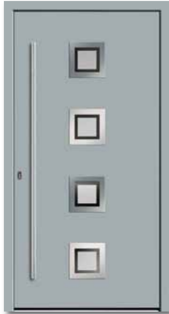
Modell 5643 | Rahmen-Edelstahloptik Glas: G 327-1 mattiertes Glas mit klarem Rand | Farbe: RAL 7001 silbergrau | Aufsatzfüllung