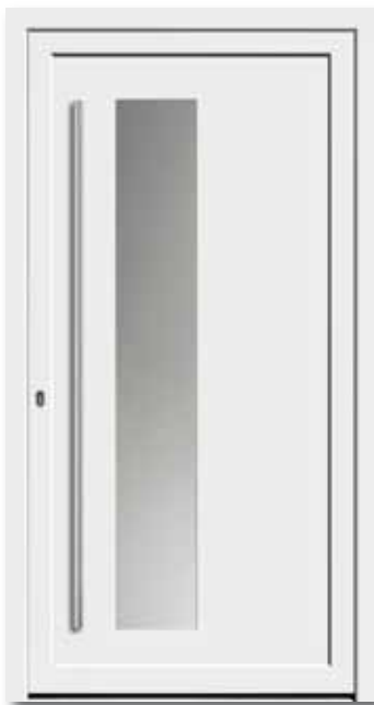
Modell 5741 Glas: Satinato weiß