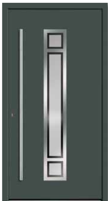
Modell 5642 | Rahmen-Edelstahloptik Glas: G 327-1 mattiertes Glas mit klarem Rand | Farbe: RAL 7012 Basaltgrau | Aufsatzfüllung