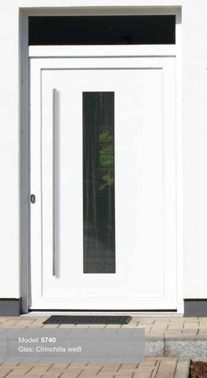
Modell 5740 Glas: Chinchilla weiß

Türen sind mehr als nur Eingänge. Sie laden ein und begrüßen. Sie gestalten den ersten Eindruck. Gleichzeitig sollen sie uns vor Hitze und Kälte, Lärm und Einbruch schützen. Alles das erfüllen die Haustüren aus der Sonderserie „Exklusiv“ von FensterART.