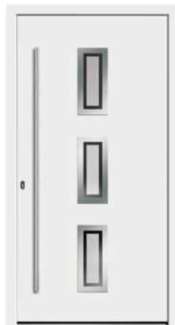
Modell 5645 | Rahmen-Edelstahloptik Glas: G 327-1 mattiertes Glas mit klarem Rand | Aufsatzfüllung