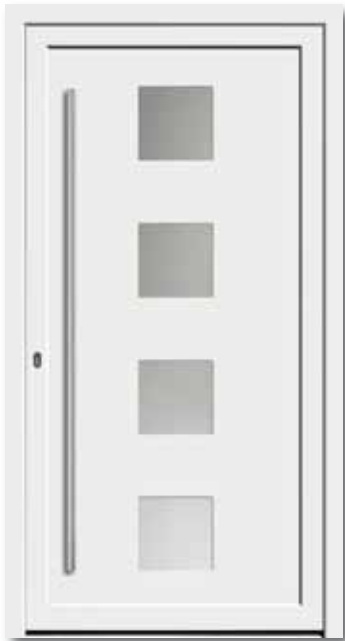
Modell 5743 Glas: Satinato weiß