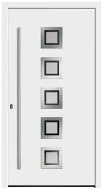
Modell 5644 Rahmen-Edelstahloptik Glas: G 327-1 mattiertes Glas mit klarem Rand | Aufsatzfüllung