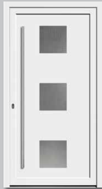
Modell 5746 Glas: Mastercarré weiß