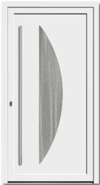
Modell 5747 Glas: Chinchilla weiß