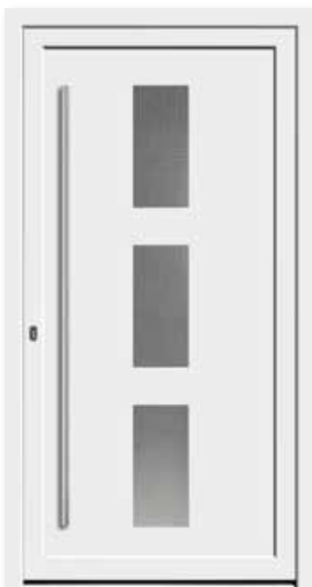
Modell 5745 Glas: Mastercarré weiß