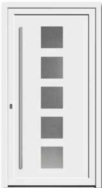
Modell 5744 Glas: Mastercarré weiß