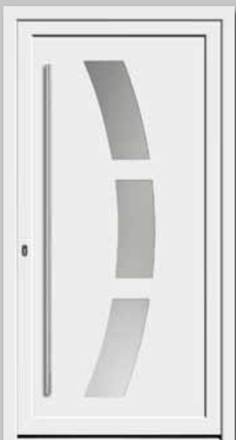
Modell 5748 Glas: Satinato weiß