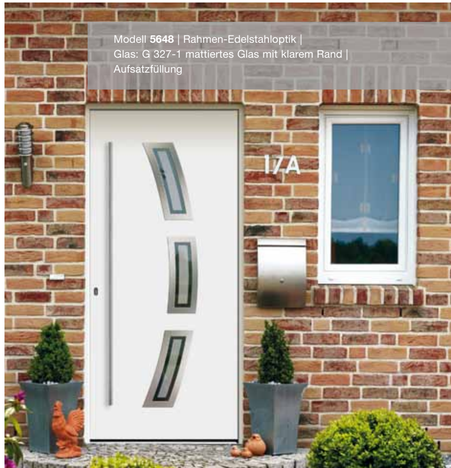
Modell 5648 | Rahmen-Edelstahloptik | Glas: G 327-1 mattiertes Glas mit klarem Rand | Aufsatzfüllung