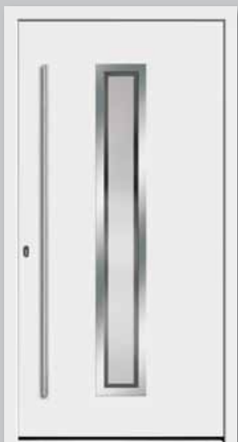
Modell 5640 | Rahmen-Edelstahloptik Glas: G 327-1 mattiertes Glas mit klarem Rand | Aufsatzfüllung