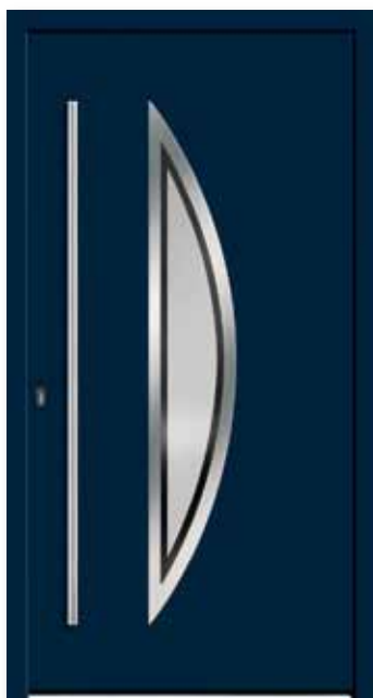
Modell 5647 | Rahmen-Edelstahloptik Glas: G 327-1 mattiertes Glas mit klarem Rand Farbe: RAL 5011 stahlblau | Aufsatzfüllung